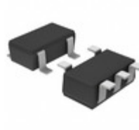
BU19TD3WG-TR Rohm Semiconductor IC REG LDO 1.9V 0.2A 5SSOP