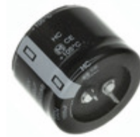
EET-HC2V821EA Panasonic Electronic Components CAP ALUM 820UF 20% 350V SNAP