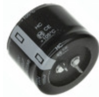
EET-HC2V821LA Panasonic Electronic Components CAP ALUM 820UF 20% 350V SNAP