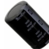
EET-HC2V561KA Panasonic Electronic Components CAP ALUM 560UF 20% 350V SNAP