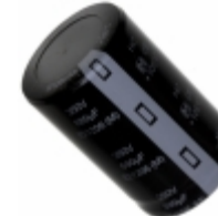
EET-HC2V681KF Panasonic Electronic Components CAP ALUM 680UF 20% 350V SNAP