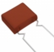
ECW-F2824JAQ Panasonic Electronic Components CAP FILM 0.82UF 5% 250VDC RADIAL