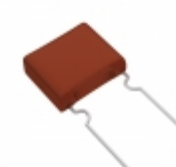
ECW-F2824RJA Panasonic Electronic Components CAP FILM 0.82UF 5% 250VDC RADIAL