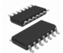
N74F10D,602 NXP Semiconductors / Freescale IC GATE NAND 3CH 3-INP 14SO