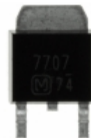
AN7707SP Panasonic IC REG LDO 7V 1.2A SP3SUA