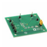
ADCMP380-EVALZ ADI (Analog Devices, Inc.) EVAL BOARD FOR ADCMP380