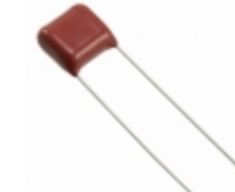
ECQ-E6473JF9 Panasonic Electronic Components CAP FILM 0.047UF 5% 630VDC RAD