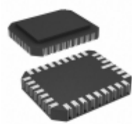
AT28C256E-20LM/883 Microchip Technology IC EEPROM 256KBIT 200NS 32CLCC