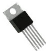
MCP1827-0802E/AT Microchip Technology IC REG LDO 0.8V 1.5A TO220-5