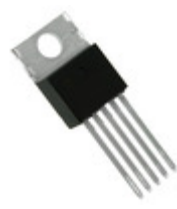
MCP1827-1202E/AT Microchip Technology IC REG LDO 1.2V 1.5A TO220-5