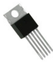
MCP1827-1802E/AT Microchip Technology IC REG LDO 1.8V 1.5A TO220-5