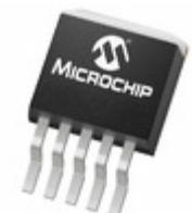
MCP1827-0802E/ET Microchip Technology IC REG LDO 0.8V 1.5A DDPAK