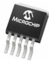
MCP1827-2502E/ET Microchip Technology IC REG LDO 2.5V 1.5A DDPAK