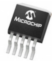
MCP1826T-ADJE/ET Microchip Technology IC REG LDO ADJ 1A DDPAK