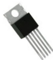
MCP1827-3002E/AT Microchip Technology IC REG LDO 3V 1.5A TO220-5