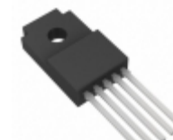
BA30BC0WT Rohm Semiconductor IC REG LDO 3V 1A TO220FP-5