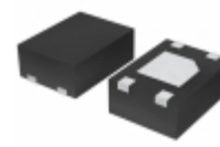
BU28TA2WNVX-TR Rohm Semiconductor IC REG LDO 2.8V 0.2A 4SSON