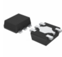
BU28TA2WHFV-TR Rohm Semiconductor IC REG LDO 2.8V 0.2A 5HVSOF