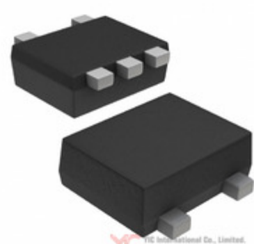
Image may be representation. See specs for product details.