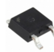
HUFA75309D3S Fairchild/ON Semiconductor MOSFET N-CH 55V 19A DPAK