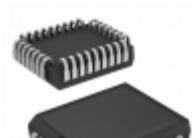
AT28HC64BF-12JU-T Microchip Technology IC EEPROM 64KBIT 120NS 32PLCC