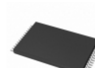
AT28HC64B-90TC Microchip Technology IC EEPROM 64KBIT 90NS 28TSOP