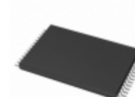
AT28HC64B-90TU-T Micrel / Microchip Technology IC EEPROM 64K PARALLEL 28TSOP