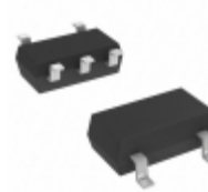
S-80137CLMC-JIWT2G SII Semiconductor Corporation IC VOLT DETECTOR 3.7V SOT23-5