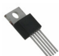
MIC29712WT Microchip Technology IC REG LDO 7.5A ADJ TO-220-5