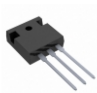
MIC29750-3.3WWT Microchip Technology IC REG LDO 3.3V 7.5A TO247-3