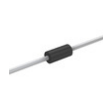
P4KE110C Littelfuse Inc. TVS DIODE 94VWM 159.6VC AXIAL