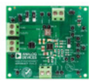
ADP5003CP-EVALZ ADI (Analog Devices, Inc.) EVALUATION BOARD