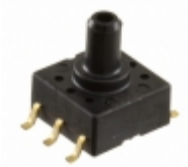
ADP4932 Panasonic Electronic Components PRESSURE SENSOR