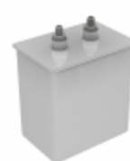
SCRN256R-F Cornell Dubilier Electronics (CDE) CAP FILM 10UF 10% 2KVPK SCREW