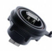
SCR01 Samtec Inc. CONN RCPT IP68 USB A PNL MNT