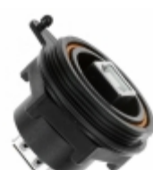
SCR02 Samtec Inc. CONN RCPT IP68 USB B PNL MNT