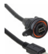
SCRUS-10-G-00.25-MBS-MB Samtec, Inc. SCRUS PANEL MOUNT SEALED USB CAB