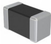
TMK042CG2R3CD-W Taiyo Yuden CAP CER 2.3PF 25V COG/NP0 01005