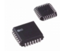
AD7845JP Analog Devices Inc. IC DAC 12BIT MULT LC2MOS 28-PLCC