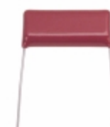
ECQ-E2105KS Panasonic Electronic Components CAP FILM 1UF 10% 250VDC RADIAL