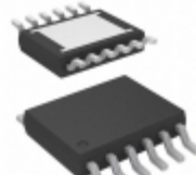
LTC3245MPMSE#TRPBF Linear Technology IC REG SWITCHD CAP 0.25A 12MSOP