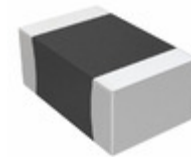
CC0805KKX5R8BB225 Yageo CAP CER 2.2UF 25V X5R 0805