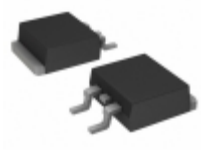
VS-ETL1506STRR-M3 Electro-Films (EFI) / Vishay DIODE GEN PURP 600V 15A TO263AB