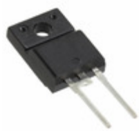
VS-ETU0805FP-M3 Vishay Semiconductor Diodes Division DIODE GEN PURP 500V 8A TO220FP