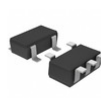
BU7421SG-TR Rohm Semiconductor IC OPAMP GROUND SENSE 5SSOP