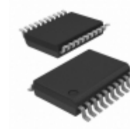
ICL3224EIA Intersil IC TXRX RS-232 3-5.5V ESD 20SSOP