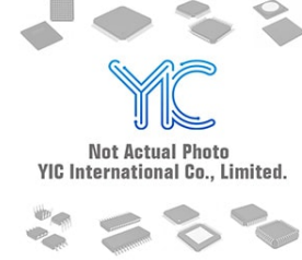
BR24G02F-WE2 ROHM RO BR24G02F-WE2 ROHM RO