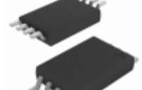
BR24G01FVT-3AGE2 Rohm Semiconductor IC EEPROM 1KBIT 1MHZ 8TSSOP