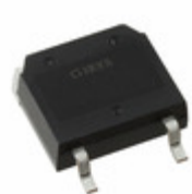
IXFT120N30X3HV IXYS Corporation 300V/120A ULTRA JUNCTION X3-CLAS