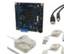
SIM3U1XX-B-DK Energy Micro (Silicon Labs) KIT DEVELOPMENT SIM3U1XX