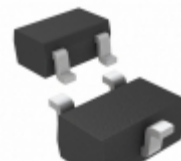
MAX6379XR46+T Maxim Integrated IC VOLT DETECT LP 4.63V SC70-3