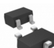
MAX6379XR37+T Maxim Integrated IC VOLT DETECT LP 3.70V SC70-3