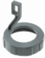
HD18-009 Agastat Relays / TE Connectivity CONN BACKSHELL SZ9 GRAY