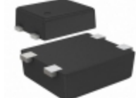
S-1000C38-I4T1U SII Semiconductor Corporation IC VOLT DETECTOR 38V SNT-4A