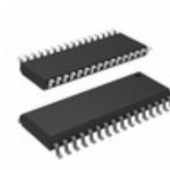
AT27C080-15RC Microchip Technology IC OTP 8MBIT 150NS 32SOIC