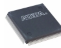
EPM7256AEQC208-7N Altera IC CPLD 256MC 7.5NS 208QFP