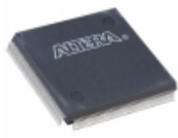
EPM7256AEQC208-7 Altera IC CPLD 256MC 7.5NS 208QFP