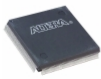
EPM7256AEQC208-5 Altera IC CPLD 256MC 5.5NS 208QFP