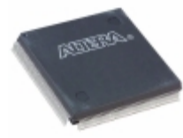
EPM7256AEQC208-7 Intel® FPGAs IC CPLD 256MC 7.5NS 208QFP