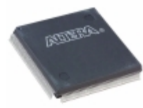
EPM7256AEQI208-7N Altera IC CPLD 256MC 7.5NS 208QFP