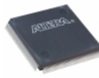
EPM7256AEQC208-5N Altera IC CPLD 256MC 5.5NS 208QFP