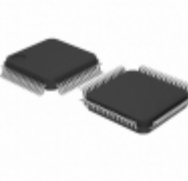
AT89C51CC03CA-RDTUM Microchip Technology IC MCU 8BIT 64KB FLASH 64VQFP