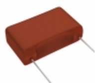
ECW-FA2J184J Panasonic Electronic Components CAP FILM 0.18UF 5% 630VDC RADIAL