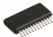
CY7C63101C-QXC Cypress Semiconductor Corp IC MCU 4K USB MCU LS 24QSOP