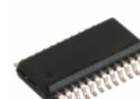
CY7C63101A-QXC Cypress Semiconductor Corp IC MCU 4K USB MCU LS 24QSOP