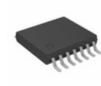
PIC16LF18425-E/ST Micrel / Microchip Technology COMPARATOR, DAC, 12-BIT ADCC