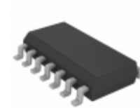
PIC16LF18424T-I/SL Micrel / Microchip Technology COMPARATOR, DAC, 12-BIT ADCC