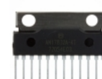
AN17832A Panasonic Electronic Components IC AUDIO AMP 15W 2CH SIL-12