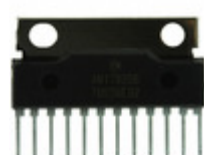
AN17820B Panasonic Electronic Components IC AUDIO AMP 7.5W 2CH SIL-12