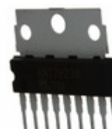
AN17823A Panasonic Electronic Components IC AUDIO AMP 4W 1CH SIL-9