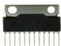
AN17821A Panasonic Electronic Components IC AUDIO AMP 5W 2CH SIL-12