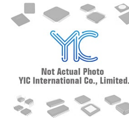
OP249G AD OP249G AD