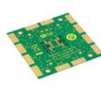
AD8004AR-EBZ ADI (Analog Devices, Inc.) BOARD EVAL FOR AD8004AR