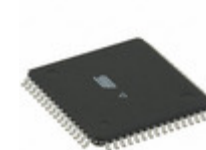
ATMEGA329P-20ANR Microchip Technology IC MCU 8BIT 32KB FLASH 64TQFP