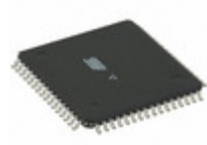
ATMEGA329P-20AU Microchip Technology IC MCU 8BIT 32KB FLASH 64TQFP