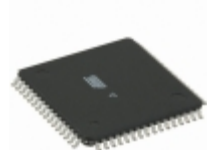
ATMEGA329P-20ANR Microchip Technology IC MCU 8BIT 32KB FLASH 64TQFP