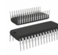
STM8S105K6B6 STMicroelectronics IC MCU 8BIT 32KB FLASH 32SDIP