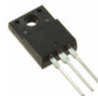
SDURF2040CTR SMC Diode Solutions DIODE ARRAY GP 400V ITO220AB