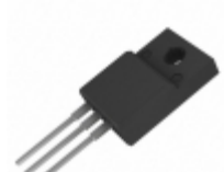
SDURF3020CTR SMC Diode Solutions DIODE GEN PURP 200V 15A ITO220AB