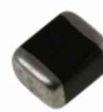
V60MLA1210NH Littelfuse Inc. VARISTOR 75V 250A 1210