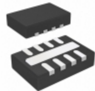
LTC2916IDDB-1#TRMPBF Linear Technology IC VOLT SUPERVISOR 8-DFN