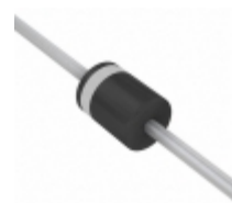
SUF30J-E3/54 Electro-Films (EFI) / Vishay DIODE GEN PURP 600V 3A P600