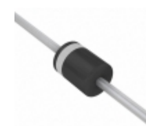
SUF30J-E3/73 Electro-Films (EFI) / Vishay DIODE GEN PURP 600V 3A P600