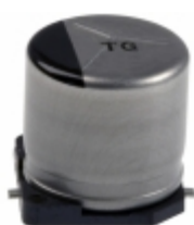
EEV-TG1H470P Panasonic Electronic Components CAP ALUM 47UF 20% 50V SMD