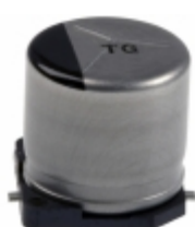
EEV-TG1J101UP Panasonic Electronic Components CAP ALUM 100UF 20% 63V SMD