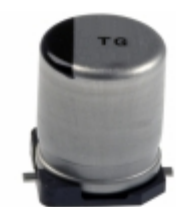
EEV-TG1J220P Panasonic Electronic Components CAP ALUM 22UF 20% 63V SMD