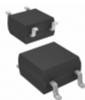
CPC1106NTR IXYS Integrated Circuits Division RELAY OPTOMOS SP-NC 75MA 4-SOP